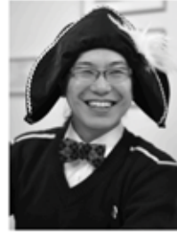
KeNho(オーディションオブザーバー) 副島正紀(PV制作) 白神ももこ(振付)